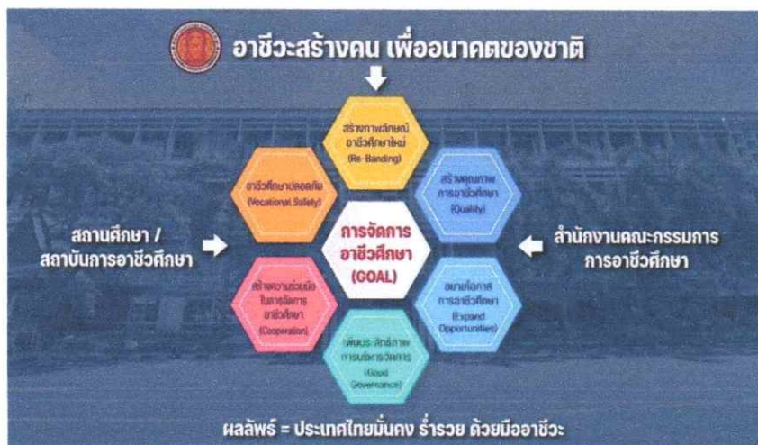
ภาพประกอบ ผังนโยบายอาชีวศึกษา