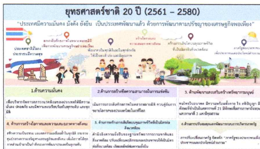
ภาพประกอบ กรอบยุทธศาสตร์ชาติ ระยะ 20 ปี(พ.ศ.2561-2580)